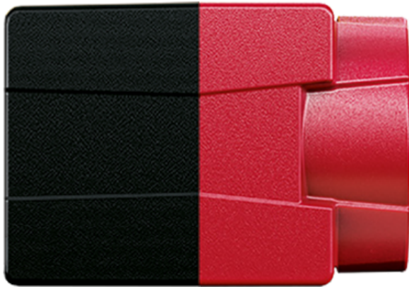
Hardware option: Closed Housing C-Mount