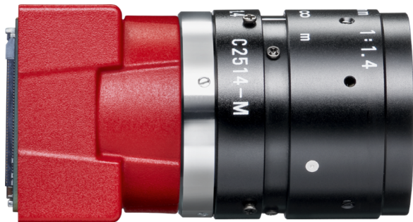
Model without hardware options